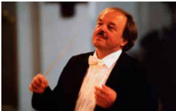
Bruno Weil

SA 23.2. 20.00 KLEINES HAUS 24,50 – 9,00 €